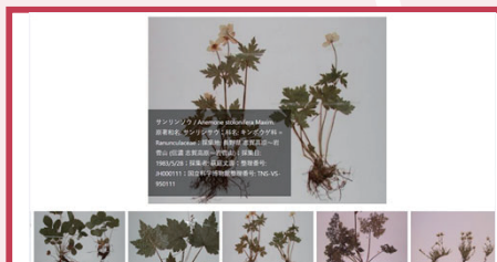
萩庭植物標本データベース

江戸時代に変種栽培が流行した朝顔をはじめ、花菖蒲・楓などの様々な品種を描いた美しい彩色図譜などのコレクション。