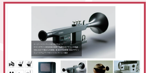
工学部工業意匠学科・デザイン工学科卒業生デザイン集

故萩庭丈壽名誉教授が生涯にわたり採集・収集したさく葉（押し葉）標本のデータベース。日本全土の顕花植物の約95%を含むと言われる。