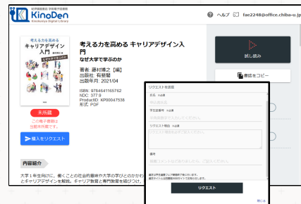
購入リクエストイメージ