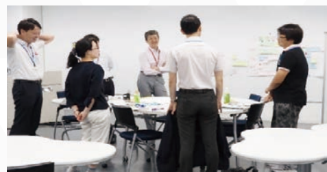
「教育・学修支援マネジメント」グループワークの様子