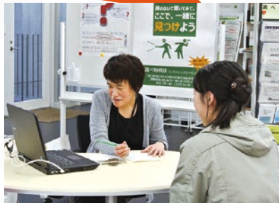
【レファレンスサービス】