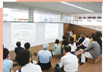
【プレゼンテーションスペース】

演習やワークショップ形式の授業を行うために、可動式の机や椅子、部屋の前後には「壁一面のホワイトボード」を備えています