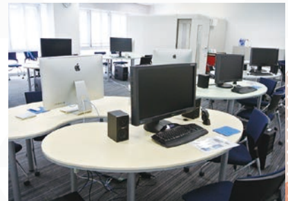
【コンテンツ制作室】

教材、授業課題、サークルなどでコンテンツ制作を行うためのデジタル環境を提供しています