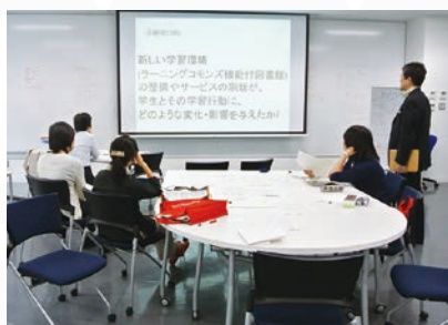
【セミナールーム「まなび」】

演習やワークショップ形式の授業を行うために、可動式の机や椅子、部屋の前には「壁一面のホワイトボード」を備えています