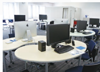
【コンテンツ制作室】

教材、授業課題、サークルなどでコンテンツ制作を行うためのデジタル環境を提供しています