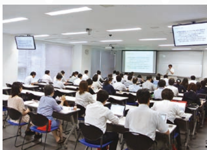
【コンテンツスタジオ「ひかり」】

教材、授業課題、サークルなどでコンテンツ制作を行うためのデジタル環境を提供しています