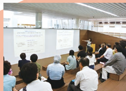
【プレゼンテーションスペース】

演習やワークショップ形式の授業を行うために、可動式の机や椅子、部屋の前には「壁一面のホワイトボード」を備えています