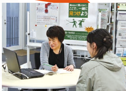
【レファレンスサービス】