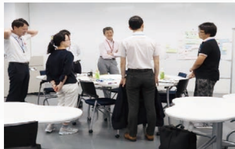
「教育・学修支援マネジメント」グループワークの様子