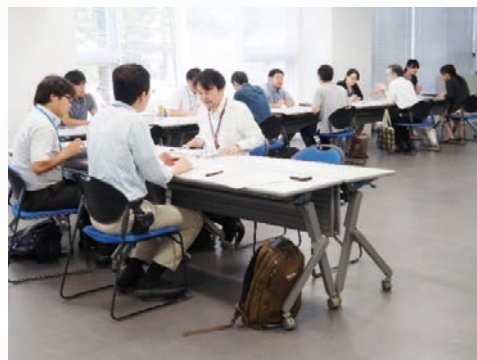
「プロジェクト研究・実習」個別相談の様子